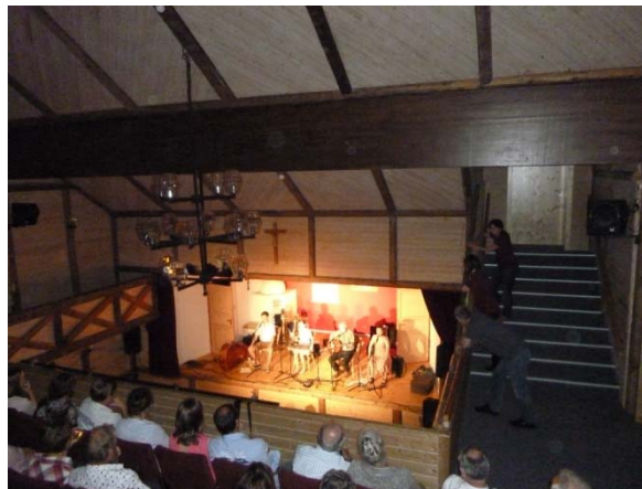
Blick von der Galerie