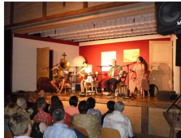
vom Saal auf die Bühne