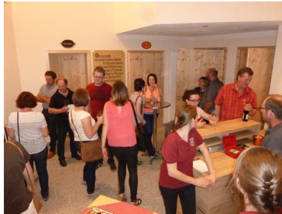
Foyer mit Ausschank