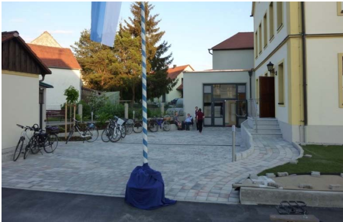
Vor dem Haus